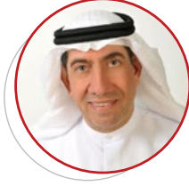
الدكتور أحمد النصيرات منسق عام برنامج دبي للأداء الحكومي المتميز الإمارات العربية المتحدة