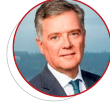
باولو غالو مستشار أول لرئيس المنتدى الاقتصادي العالمي في جينيف، مدير تنفيذي، متحدث رئيسي، وواحد من المؤلفين الأكثر مبيعًا في سويسرا